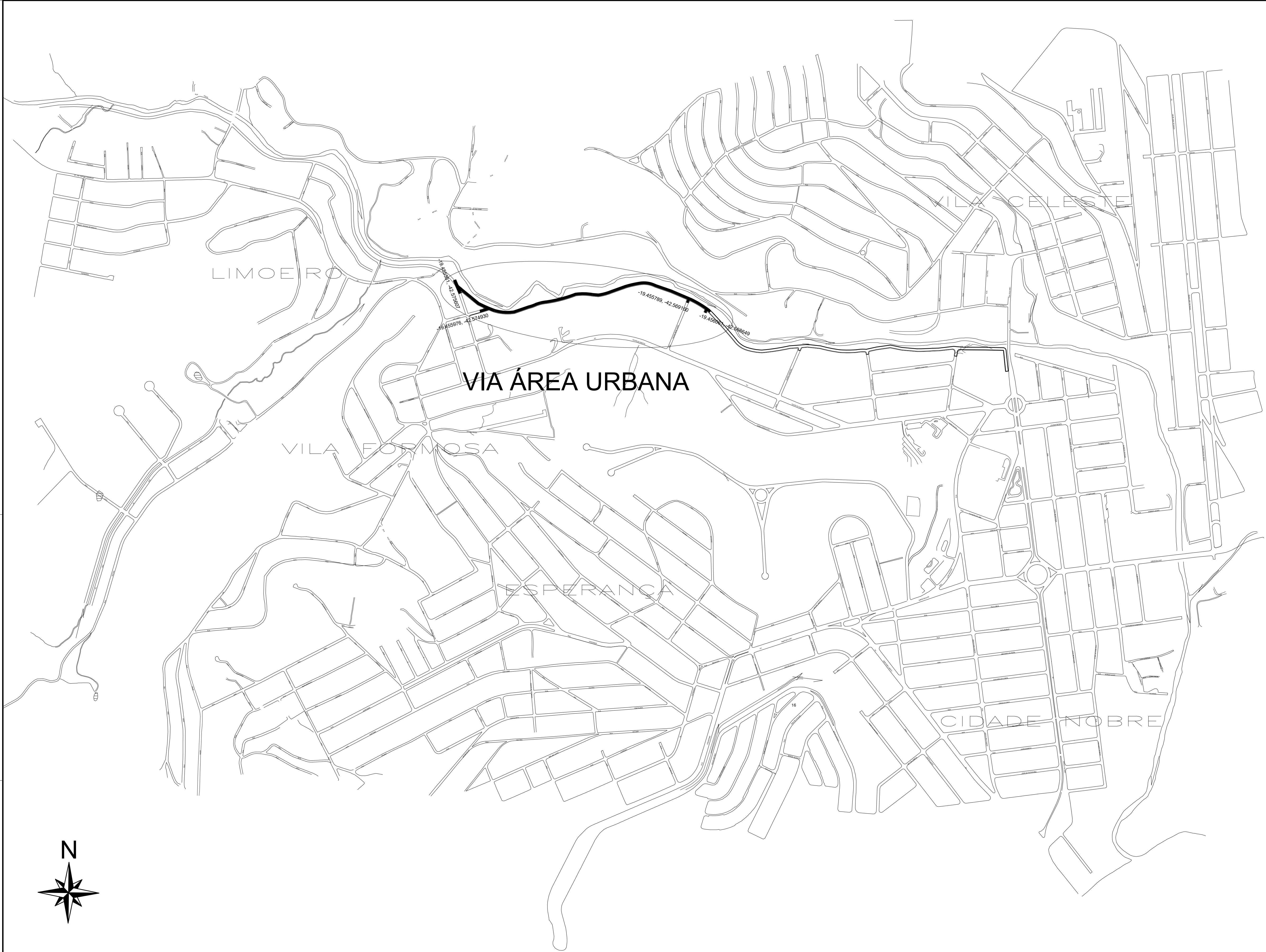
PLANTA LOCAÇÃO AVENIDA SANITÁRIA ESCALA: 1/1000